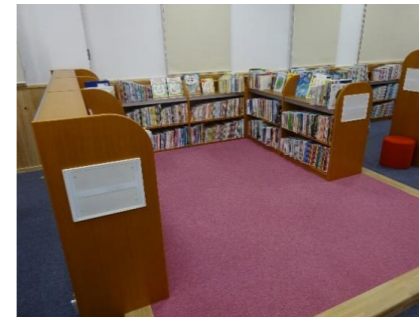
おはなしコーナー