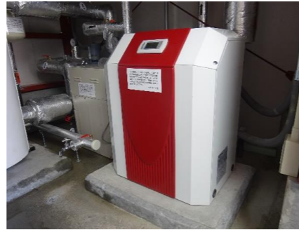
地中熱ヒートポンプ設備