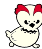
南アルプス市立図書館キャラクター ライライ