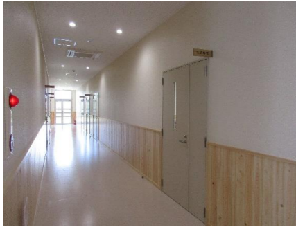
県産材を使用した施設内